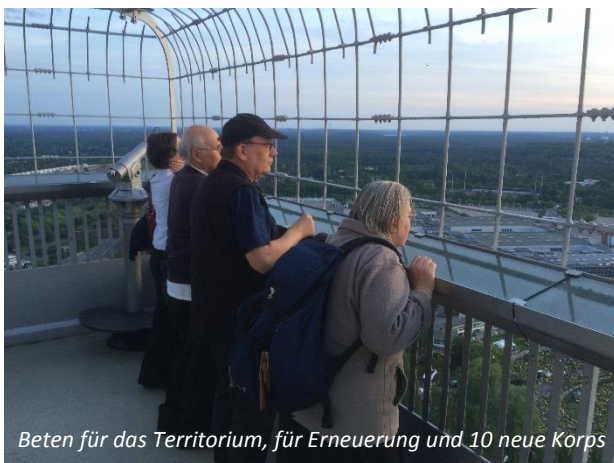
Beten für das Territorium, für Erneuerung und 10 neue Korps

In Zweiergruppen ging es fürbittend und segnend durch das Wohnviertel des Korps (Berlin-Friedenau). Nach dem Abendessen zog ein kleiner Trupp von fünf Betern zum Messegelände und betete schließlich von der Aussichtsplattform des Funkturms für die Stadt, das Land, das Territorium, für Erneuerung und 10 neue Korps bis 2030!