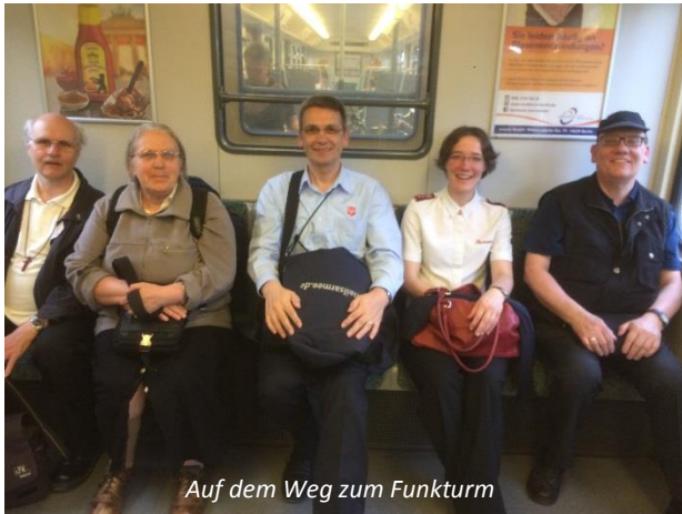
Auf dem Weg zum Funkturm

Wir lobten Gott mit Liedern und dankten für alle Aufbrüche, die wir schon sehen dürfen.