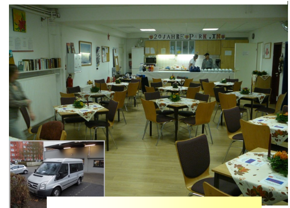
Unser Aufenthaltsraum und der Straßensozialarbeiter-Bus